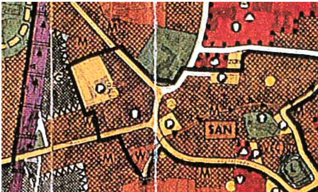
Abb. Auszug aus dem Flächennutzungsplan der Stadt Lohne, ohne Maßstab.

Für die Stadt Lohne liegt ein wirksamer Flächennutzungsplan vor. Er wurde mit Verfügung vom 26.04.1982 genehmigt und mit Bekanntmachung vom 07.05.1982 wirksam.