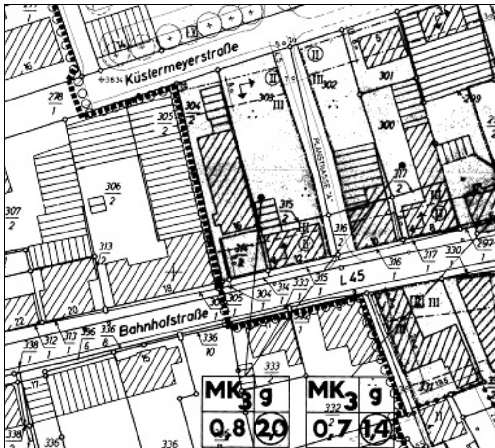
Abb. Auszug aus dem Bebauungsplan Nr. 19A (1982), ohne Maßstab.

Mit diesem Bebauungsplan Nr. 152 werden Teile der Bebauungspläne Nr. 100 und Nr. 19A überplant, die bereits Kerngebiete festsetzten. Mit Inkrafttreten dieses Bebauungsplanes verlieren die bisherigen Festsetzungen der Bebauungspläne Nr. 100 und Nr. 19A in diesen Teilbereichen ihre Gültigkeit; stattdessen gelten hier fortan die Festsetzungen des Bebauungsplanes Nr. 152.