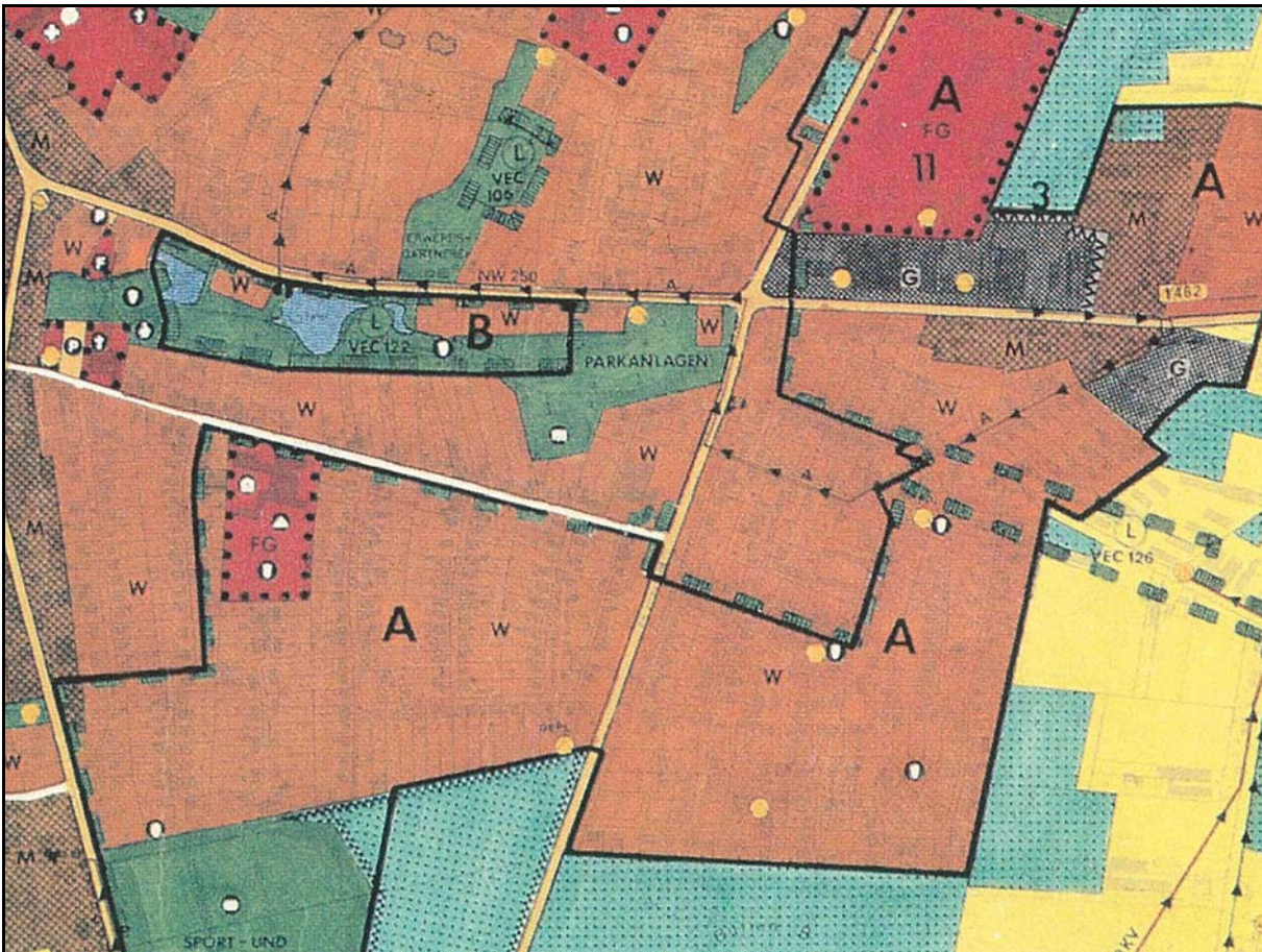
Abb.: Ausschnitt aus dem Flächennutzungsplan der Stadt Lohne, 1982 (1 : 10.000)

Der Flächennutzungsplan der Stadt Lohne, der am 07.05.1982 rechtswirksam wurde, stellt innerhalb des Geltungsbereiches der 2. Änderung des Bebauungsplans Nr. 14 wie auch für die angrenzenden Grundstücke Wohnbauflächen dar. Auch südlich der Josefstraße und östlich des Bergweges schließen sich Wohnbauflächen an. Der Stadtpark wie auch die Freilichtbühne sind als Grünfläche dargestellt.