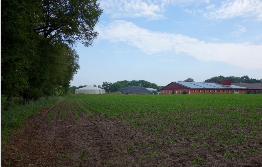
Abb. 4: Blick aus Süden auf die Ackerfläche des Flurstückes 2/4; am linken Bildrand die entlang der westlichen Flurstücksgrenze verlaufende Wallhecke, im Bildhintergrund Teile der Biogasanlage und ein Maststall (07.06.2023).

Südlich der Biogasanlage und damit im Südwesten des Flurstückes 2/4 befindet sich eine Ackerfläche, die intensiv zum Anbau von Mais genutzt wird. Die westliche Flurstücksgrenze wird von einer Wallhecke mit altem Eichenbestand begleitet (Abb. 4); diese befindet sich außerhalb des Sondergebietes Biogas.