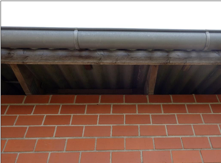
Abb.8: Beispiel für ein Stallgebäude mit einer Öffnung unter dem Dach, in die Fledermäuse in Hohlräume gelangen könnten (20.04.2023).

Im Rahmen der durchgeführten Überprüfung der Gebäude des östlich an den Plangeltungsbereich angrenzenden landwirtschaftlichen Betriebes waren in einigen Bauten für Fledermäuse potenziell geeignete Strukturen nachzuweisen. So sind in einigen Stallgebäuden Öffnungen im Dachbereich vorhanden (vgl. Abb. 8). An dem Fermenter der Biogasanlage wurden Brutvorkommen für den Star ermittelt (vgl. Kap. 4.2), welcher Hohlräume zur Nestanlage benötigt. Diese befinden sich im Bereich zwischen dem Überstand der Außenmembranfolie und dem Stahlmantel (Abb. 9) des Gebäudes 25 (vgl. Abb. 1). Aufgrund dieser Nachweise eines Höhlenbrüters müssen an dem Fermenter Hohlräume vorhanden sein, die ggf. auch für Fledermäuse geeignete Quartierstätten darstellen könnten, wenngleich keine Spuren von Fledermäusen festgestellt wurden. Derartige Quartiere im Bereich von Biogasanlagen sind dem Verfasser bislang weder bekannt, noch finden sich Angaben zu solchen Quartierformen in der einschlägigen Literatur.