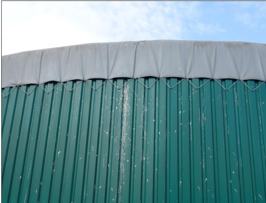
Abb. 9: Am Fermenter könnten zwischen dem Überstand der Außenmembranfolie und dem Stahlmantel für Fledermäuse geeignete Hohlräume vorhanden sein; der Star ( Sturnus vulgaris ) nutzt diese als Brutplatz (07.06.2023).

Insgesamt betrachtet erweist sich das Umfeld des Sondergebietes Biogas als für die Fledermausfauna vergleichsweise strukturreich. Es sind für Fledermäuse potenziell geeignete Baum- und Gebäudequartiere vorhanden. Unter den Spezies, die Quartiere in Baumhöhlen beziehen, könnten potenziell z. B. Großer Abendsegler, Braunes Langohr und andere Höhlen im Bereich des Waldes (vgl. Abb. 7) bewohnen. Diverse sonstige Strukturen könnten als Tagesversteck genutzt werden. Unter den Gebäudefledermäusen könnten z. B. Breitflügel- und/oder Zwergfledermaus Hohlräume in angrenzenden Stallgebäuden sowie innerhalb des Sondergebietes Biogas am Fermenter beziehen (Abb. 8 + 9).