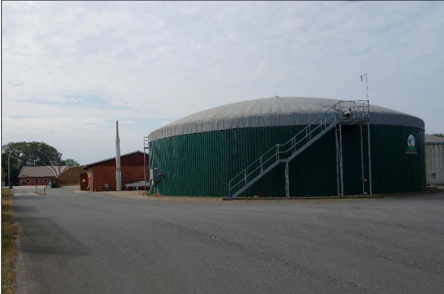
Abb. 2: Blick aus Norden auf das Betriebsgelände der Biogasanlage; versiegelte Flächen und Gebäude, wie z. B. Fermenter, Gärrestspeicher und Technikgebäude, prägen den Bereich; im linken Bildhintergrund die Fahrsiloplanlage und ein Maststall (07.06.2023).

Mit DRACHENFELS (2021) sind im Plangebiet Biotope aus verschiedenen Hauptgruppen vertreten. In erster Linie sind dies Gebäude, Verkehrs- und Industrieflächen, unterschiedliche Gehölze sowie Äcker, lokal finden sich Biotope aus den Gruppen der Ruderalfluren und Gewässer. Der größte Flächenanteil wird von den Betriebsflächen der Biogasanlage und Stallanlagen eingenommen. Kennzeichnend für diese Bereiche sind neben diversen Gebäuden auch größere versiegelte Flächen (Abb. 2), die insbesondere zur Lagerung von Betriebsstoffen (Silage) und als Fahrwege dienen.