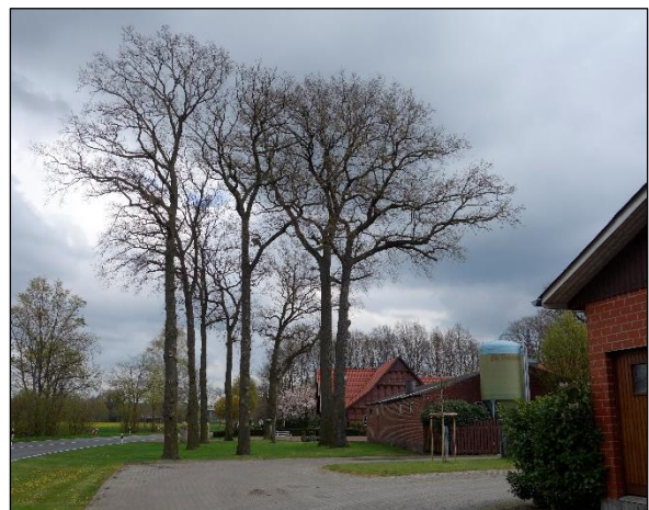
Abb. 3: Auf dem Gelände des landwirtschaftlichen Betriebes stehen zahlreiche Altbäume (20.04.2023).