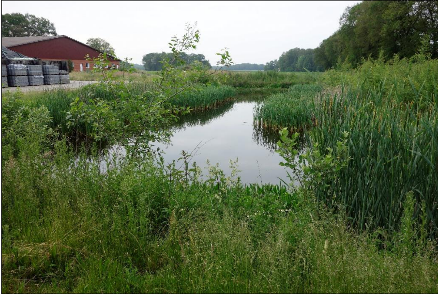
Abb. 6: Gewässer im Südwesten des Flurstückes 2/5 mit Röhricht (07.06.2023).

Die Biogasanlage wird im Norden und Westen von einem mit Sträuchern bewachsenen Erdwall umgeben. Im Südwesten des Geländes befindet sich zwischen dem Erdwall und der Fahrloanlage ein rechteckig angelegtes Gewässer mit naturfernen Strukturen und teils naturnahem Bewuchs aus z. B. Gewöhnlichem Froschlöffel und Rohrkolben-Röhricht, lokal treten Schwimmblattpflanzen auf (Abb. 6). Im Umfeld des Gewässers sind halbruderale Gras- und Staudenfluren vorhanden.