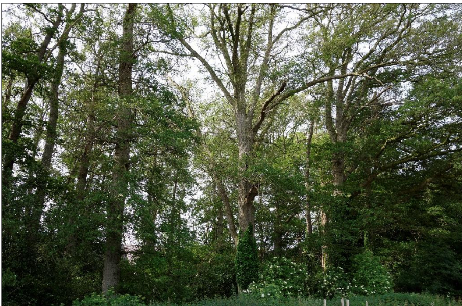
Abb. 5: Im Süden des Flurstückes 2/4 befindet sich ein Wald aus überwiegend alten Eichen (07.06.2023).

Östlich der Ackerfläche und damit außerhalb des Sondergebietes Biogas stockt ein Wald mit einer Gesamtgröße von ca. 0,5 ha. Dieser liegt teils auf dem Flurstück 2/4 und teils auf dem südlich angrenzenden Flurstück 29/2. Prägend ist ein hoher Anteil von alten Eichen mit starkem bis sehr starkem Baumholz von ca. 0,4 m bis mehr als 0,8 m im Durchmesser (Abb. 5).