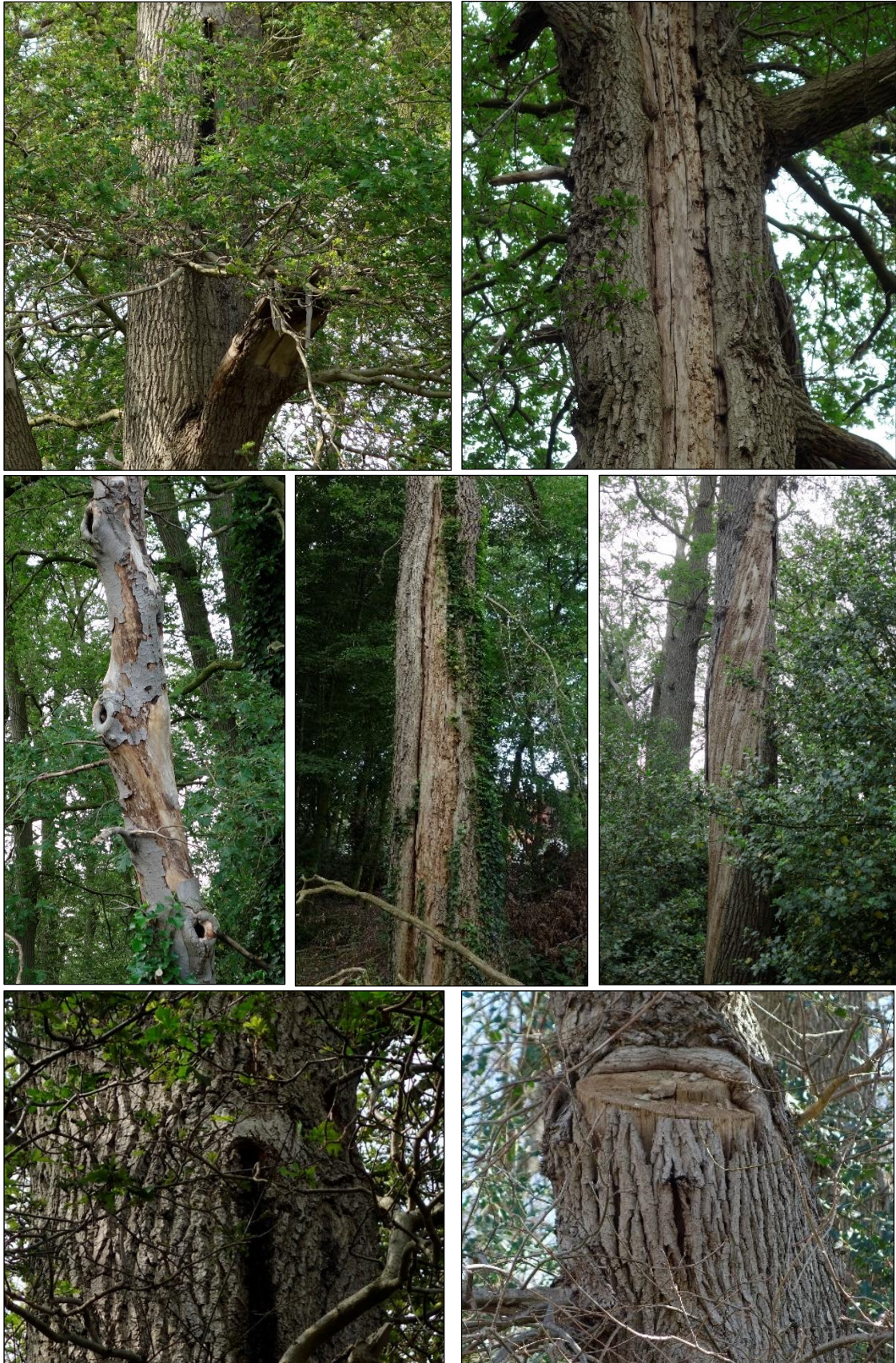
Abb. 7: Beispiele von Bäumen im Bereich des Waldes mit Höhlen bzw. Spalten, die potenziell von Fledermäusen als Quartierstätten genutzt werden könnten (20.04./07.06.2023).