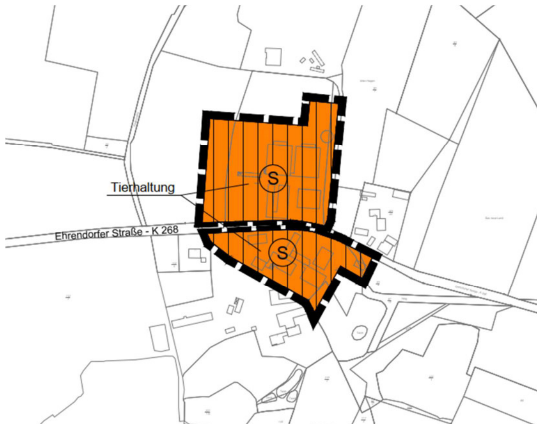
Abb. 2: Ausschnitt aus dem rechtswirksamen Flächennutzungsplan

Die 1. Änderung kann demnach aus dem bestehenden Flächennutzungsplan entwickelt werden.