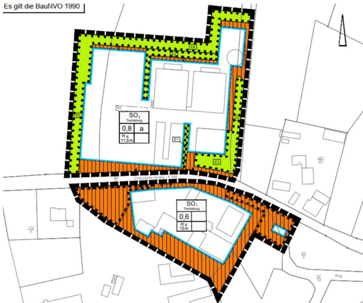
Abb. 3: Bebauungsplan Nr. IV für den Bereich „Landwirtschaftliche Hofstelle Ehrendorfer Straße 7“

Der Bebauungsplan setzt für die Plangebietsflächen der vorliegenden 1. Änderung im zentralen und im nordöstlichen Bereich ein Sonstiges Sondergebiet SO 1 mit der Zweckbestimmung „Tierhaltung“ fest. Zudem ist eine Grundflächenzahl von 0,6 bei einer maximalen Höhe der baulichen Anlagen von 13 m festgesetzt. Im nordöstlichen und nordwestlichen Geltungsbereich sind zudem Flächen mit Bindungen für Bepflanzungen und für die Erhaltung von Bäumen, Sträuchern und sonstigen Bepflanzungen sowie von Gewässern festgesetzt.